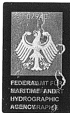
(Seal or stamp of issuing authority, as appropriate) (Siegel bzw. Stempel der ausstellenden Behörde)

(Signature of the duly authorized official issuing the certificate) (Unterschrift des ordnungsgemäß ermächtigten Bediensteten, der das Zeugnis ausstellt)