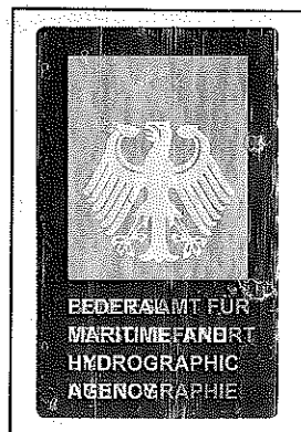
(Seal or stamp of issuing authority, as appropriate) (Siegel bzw. Stempel der ausstellenden Behörde)

(Signature of the duly authorized official issuing the certificate) (Unterschrift des ordnungsgemäß ermächtigten Bediensteten, der das Zeugnis ausstellt)